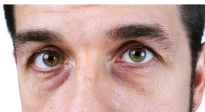
Figura 1. Olheiras

As olheiras (parte escura embaixo dos olhos) aparecem por um conjunto de fatores, como idade, herança familiar, estresse, sono de má qualidade, alergias, uso de alguns tipos de colírios e são difíceis de serem removidas fig. 1