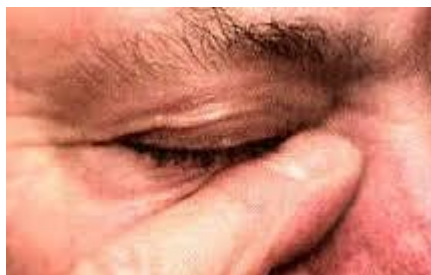
Figura 2. Para os portadores de Glaucoma, ao instilar o colírio, comprimir os pontos lacrimais situados no canto nasal de cada olho.

Caso seja necessário o uso de 2 colírios para um tratamento, dar um intervalo aproximado de 15 minutos entre um colírio e o outro.