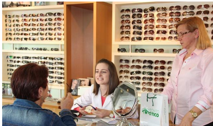
Figura 3. Óptico.

orçamento, com o tipo físico (atlético, franzino, etc.) e com a personalidade do portador (reservada, extrovertida, etc.)” , figura 3.