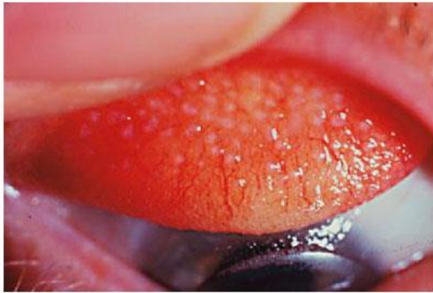
Fase inicial da CPG