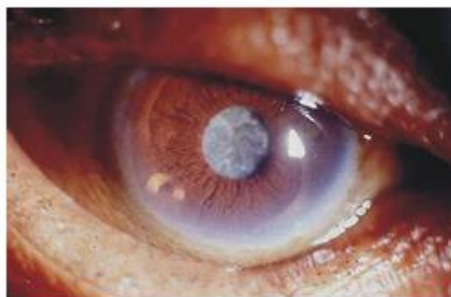
Figura 2: Cristalino com catarata.

Se compararmos o cristalino a um ovo, podemos dizer que o cristalino possui casca (cápsula envoltória), clara (córteç) e gema (núcleo). Assim, a opacidade pode ocorrer em qualquer parte da lente: se ocorrer na parte periférica (na