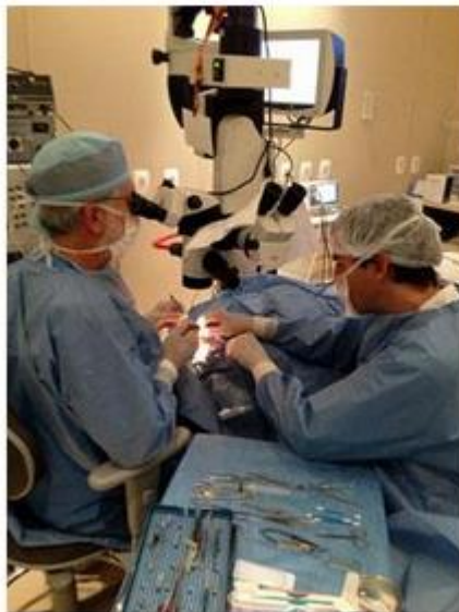
Figura 4: Cirurgia de Catarata: Facoemulsificação.

E marque uma hora para conversar comigo sobre a cirurgia, os cuidados pré e pós cirúrgicos e para que eu possa solucionar suas dúvidas.