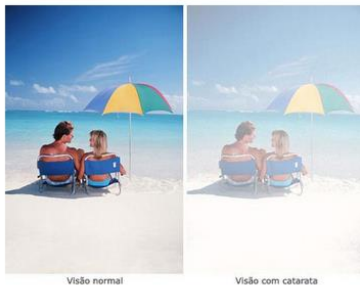
Figura 3- Alteração na visão pela catarata.